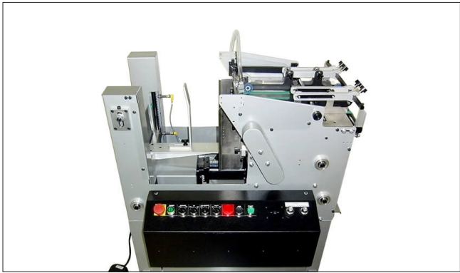
KR 502 N – Napkin Feeder Bietet einen gleichmäßigen Vorschub für schwierige Produkte mit einstellbaren Führungen.