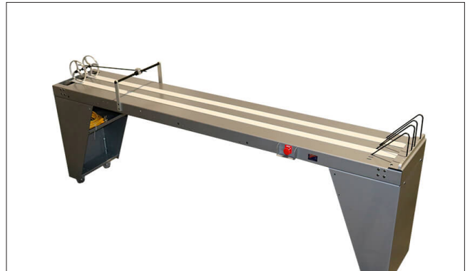
KR314 – Shingle Conveyor