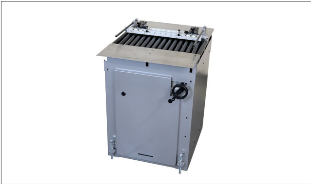
KR840R – Roller Registration