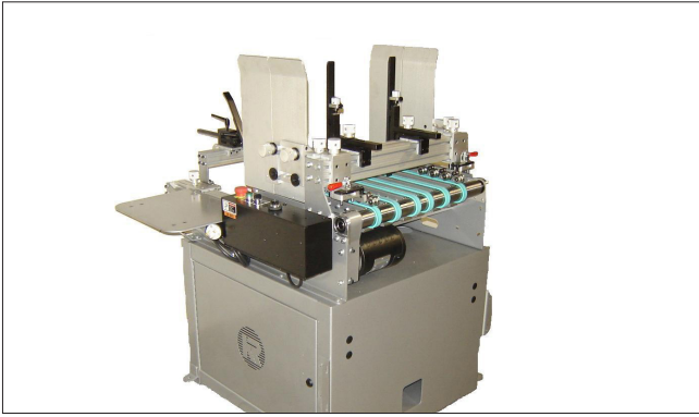
KR 500 – Friction Feeder Einzug von flachen, gestanzten Schachteln und anderen schwierigen Produkten.