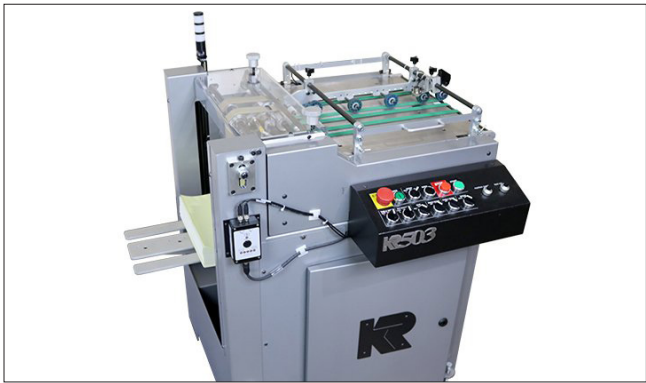
KR 503 – Friction Pile Feeder Stapeleinzug mit großem Papierfach für den Einzel- druck von bis zu 4.000 Papierbögen in der Größe bis DIN A3 plus.