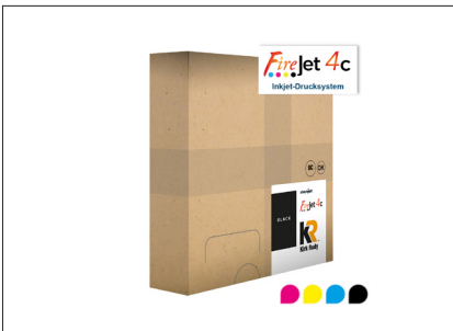
KIRK-RUDY™ Ink-Supply Wässrige Pigmenttinte in der 2 Liter-Box pro Farbe