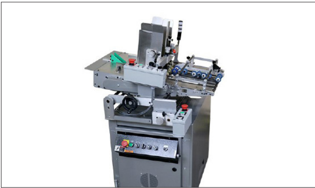
KR 497 BW – Servo Friction Feeder